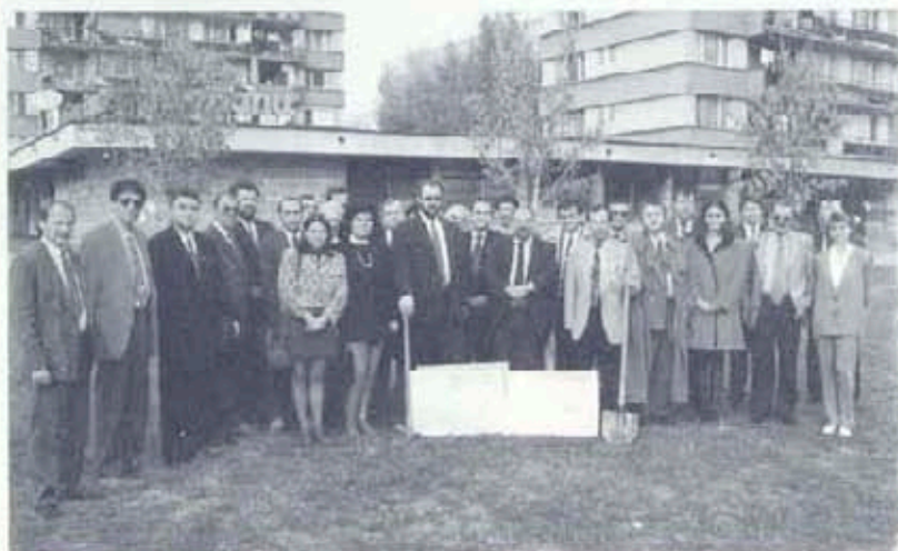
Участниците във II национален Ротари семинар на мястото, където ще бъде алеята

Планировъчното решение се основава на центростремителния принцип с ясно оформени йерархични нива. Композицията се балансира посредством поредицата от концентрични кръгове, които комуникират помежду си с радиални връзки в ясни пропорционални съотношения. Идеята е посредством изкачване към центъра на градината човек да се докосне до пирамидата - символ на стабилност и балансираност в света. Тя е и един естествен завършек на цялата композиция. Във вътрешността на пирамидата са мон-