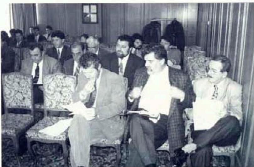
Участниците в семинара