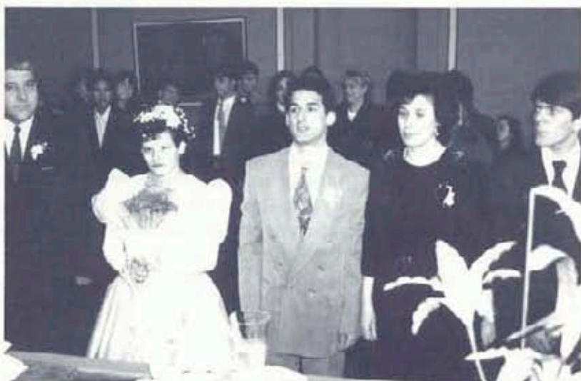
Сватба на възпитаници на Дома за средношколци, подпомогнати от РК - Пловдив

И още нещо - към тази инициатива на жените се присъединиха и техните деца, младежният Ротари клуб, които направиха също дарителска акция. Донесоха няколко кашона с грехи, много добре запазени, почистени и изгладени, вероятно от собствениците им грехи.